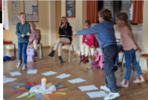
Bilder und Text: Ute Harter